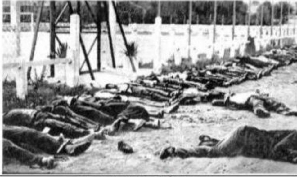
بعض جث القتلى التي أعدم أصحابها في مجازر ماي 1945

الملحق (02): بعض القتلى التي أعدم أصحابها في مجازر ماي 1945