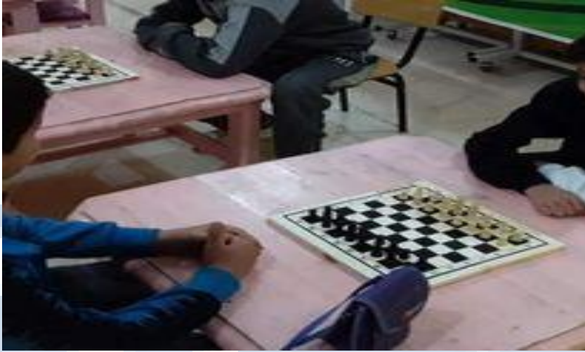
الألعاب الترفيهية (لعبة الشطرنج)