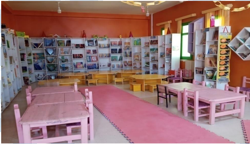
قاعة المطالعة الخاصة بقسم الطفل