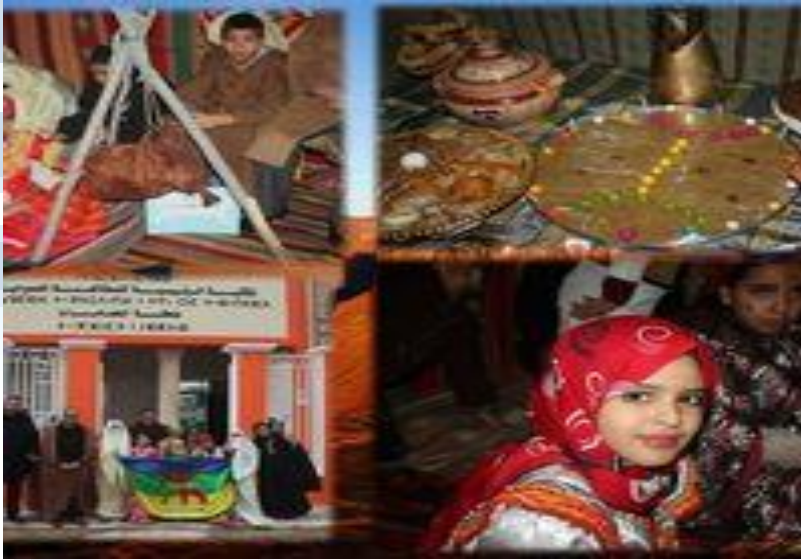
إحياء مناسبة ذكرى يناير