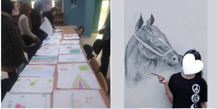
بعض رسومات المشاركين في مسابقة الرسم