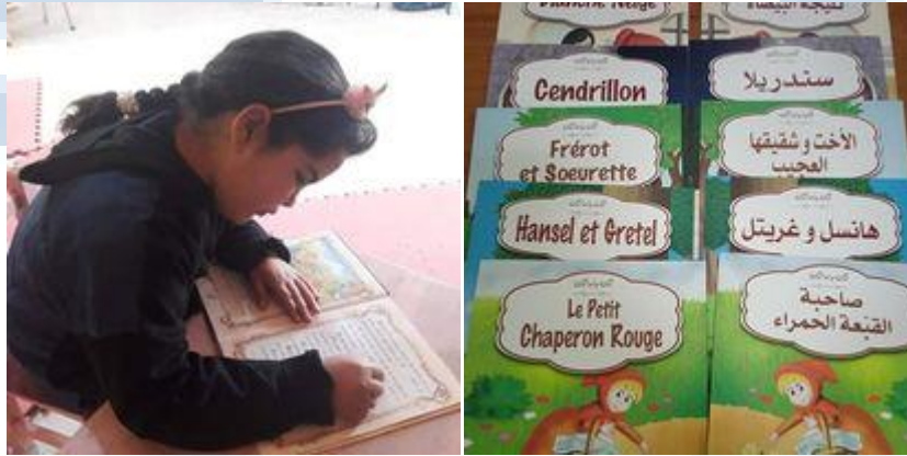
فقرة قراءة قصة