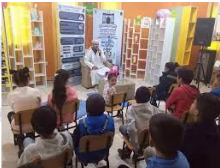
فقرة الحكواتي في مكتبة المطالعة العمومية في قسم الطفل