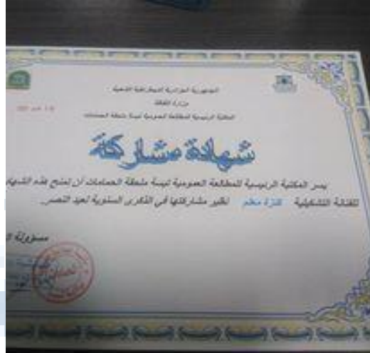
شهادة مشاركة في الذكرى السنوية لعيد النصر