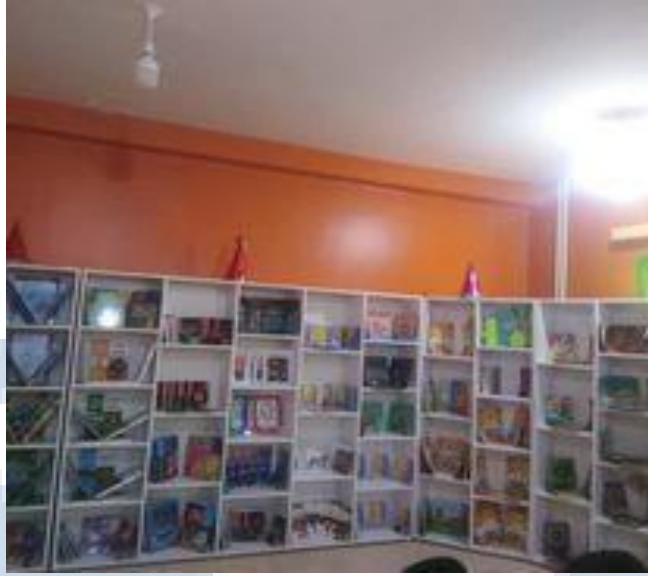
رفوف الرصيد في القسم الخاص بالطفل