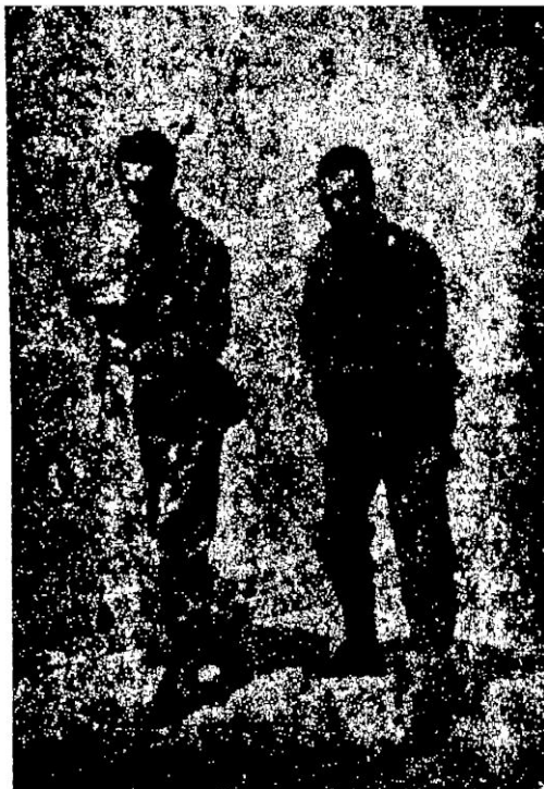
عبد الحفيظ بوصوف ومعاونه هوازي بومدين قائد، جبهة وهران بمركز قيادة وهران بعد وصول بومدين على الهبنت دينا

Converted by Tiff Combine - (no stamps are applied by registered version)