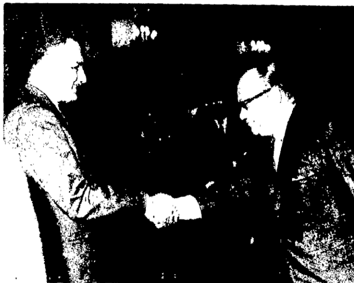
فتحي الديب في لقاء الزعيم الراحل

Converted by Tiff Combine - (no stamps are applied by registered version)