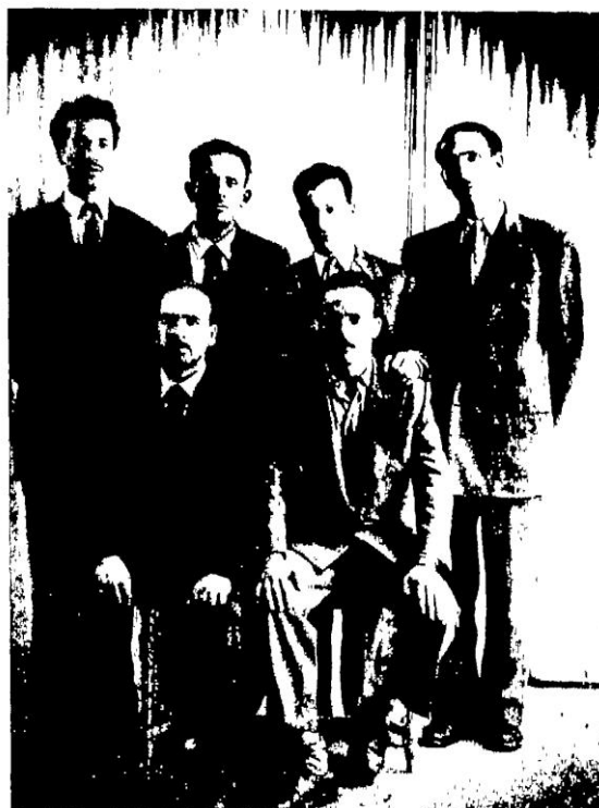
الاجتاع الجهدى لقادة الثورة الجزائرية برن سوسرا - أكتوبر سنة ١٩٥٤

Converted by Tiff Combine - (no stamps are applied by registered version)