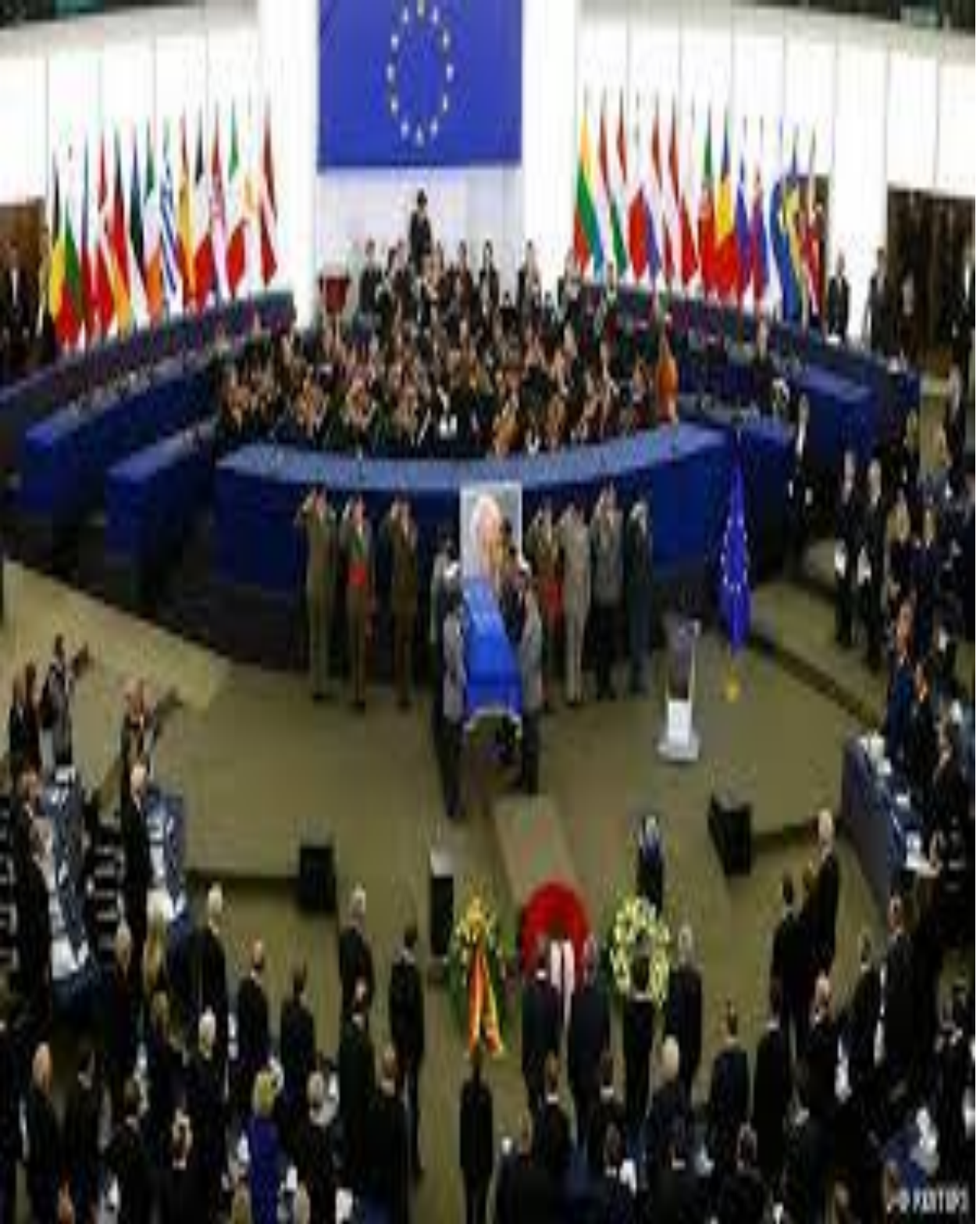
الصورة توضح جنازة هلموت كول