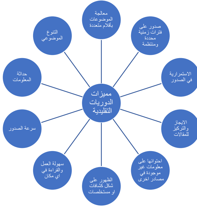
الشكل (1): تصور أولي لمميزات الدوريات التقليدية