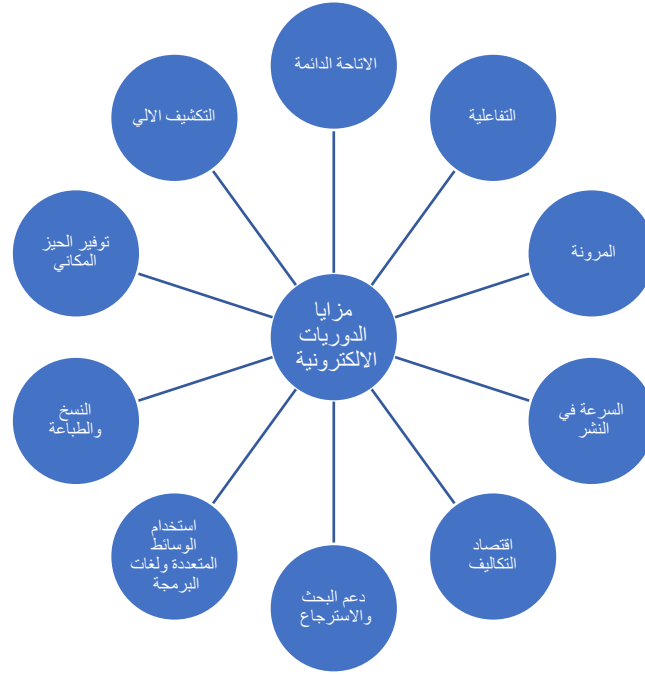
الشكل(03): تصور أولي لخصائص و مزايا الدوريات الإلكترونية

وبين لنا الشكل رقم (03) تصور أولي لمزايا الدوريات الإلكترونية: