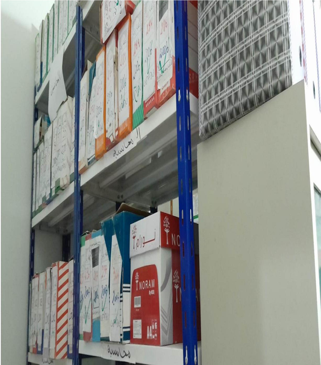
الملحق رقم 02