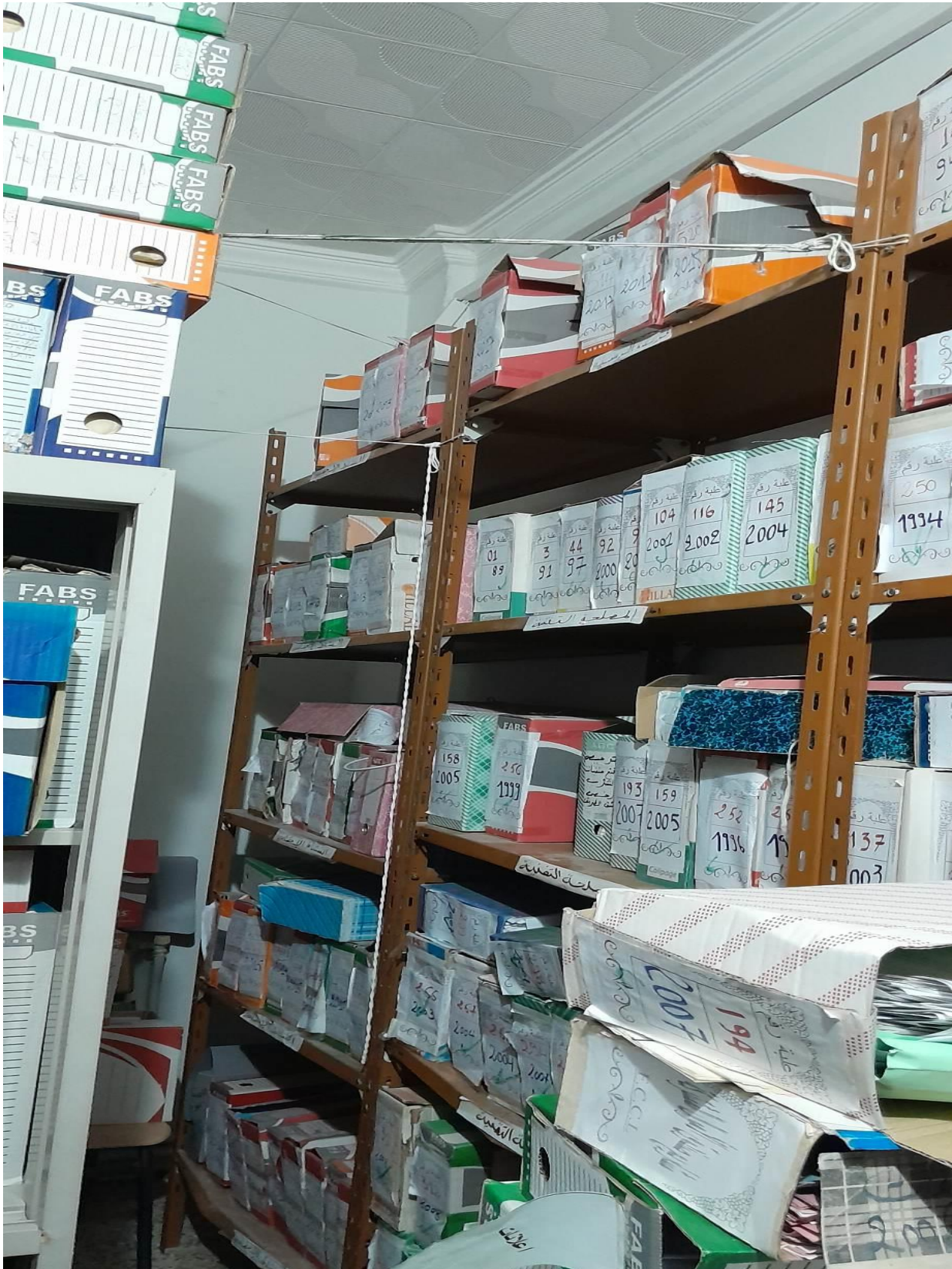
الملحق رقم 03