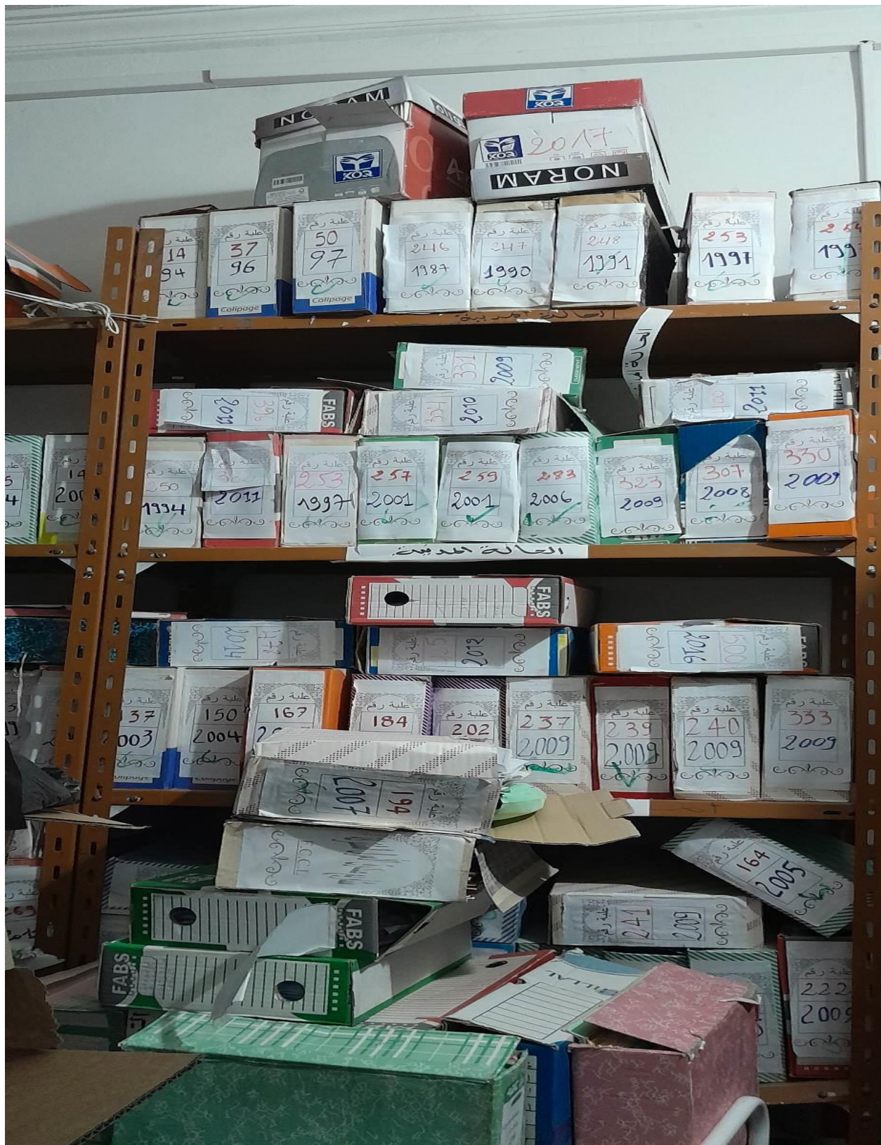
الملحق رقم 05