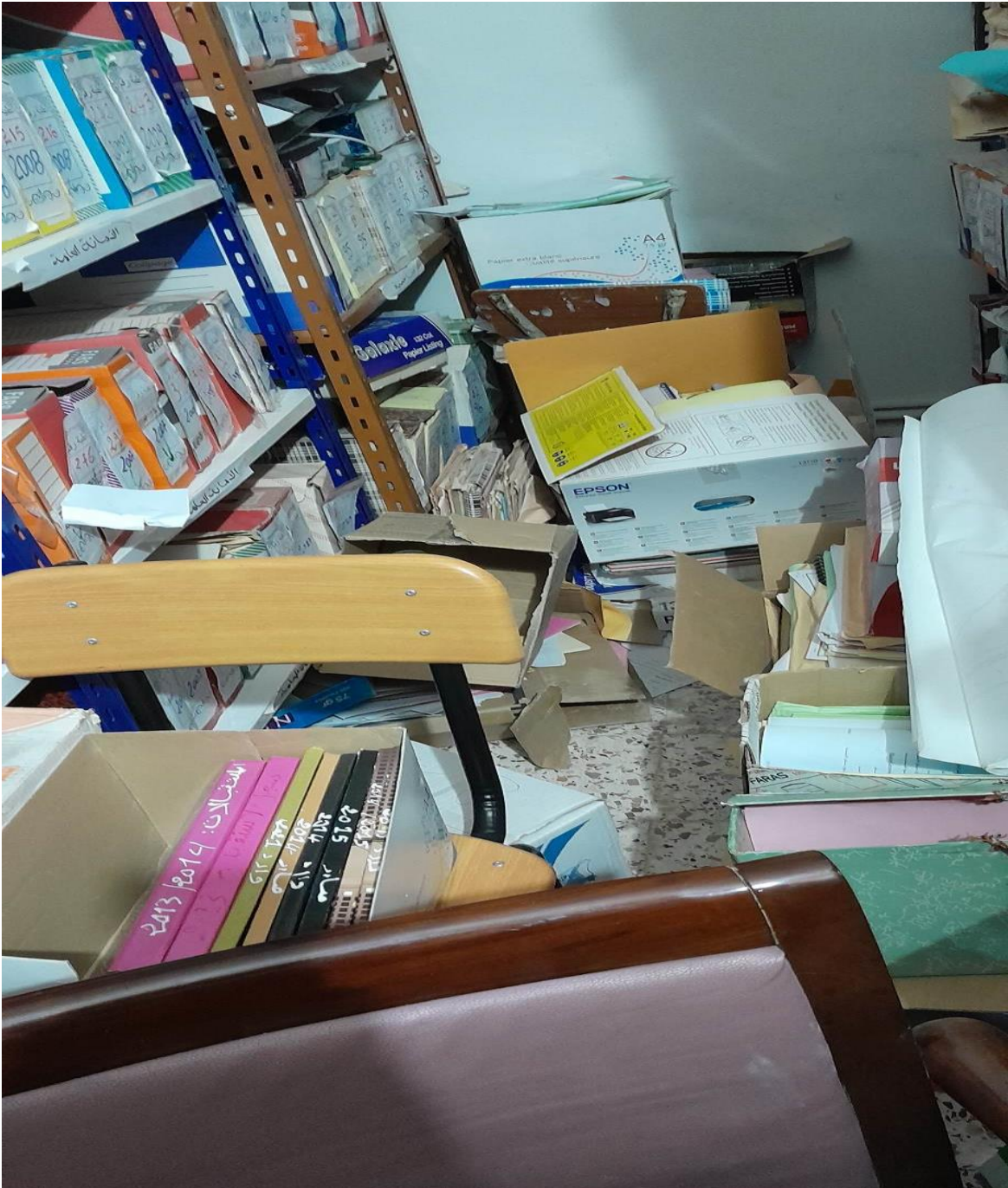
الملحق رقم 04