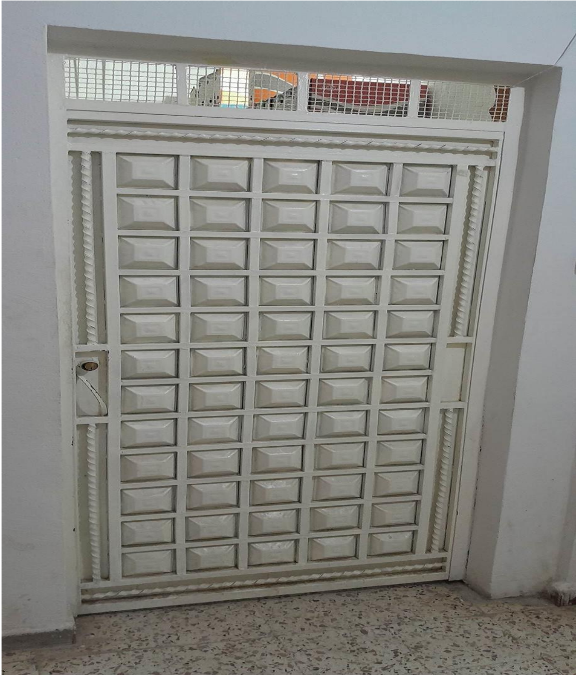
الملحق (01): مدخل مكتب الأرشيف