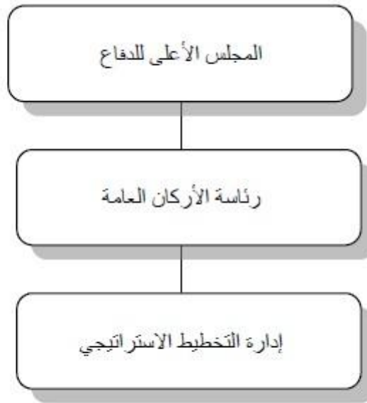
الشكل 1: ارتباط إدارة التخطيط الاستراتيجي بهيكل المؤسسة العسكرية

والشكل رقم (1) يبين موقع الإدارة بالهيكل التنظيمي للمؤسسة.