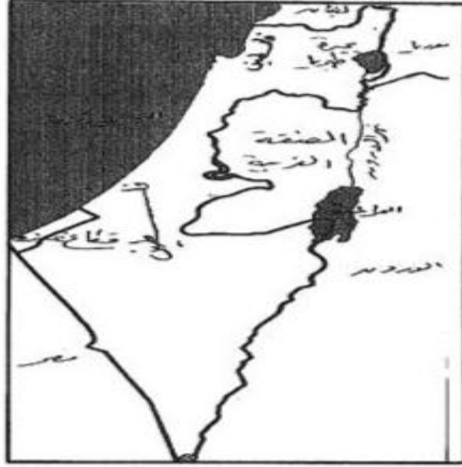
خريطة رقم (1) موقع فلسطين بين الدول العربية

رفيق شاكر النتشة: تاريخ فلسطين وجغرافيتها، المؤسسة العربية للدراسات والنشر، بيروت، 1991، ص 10.