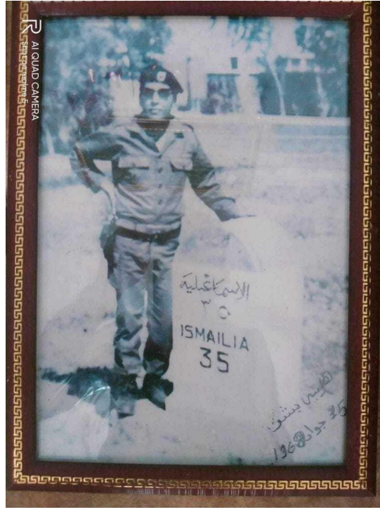
صورة للضابط هيبا هيبا في مصر "جوان 1968"