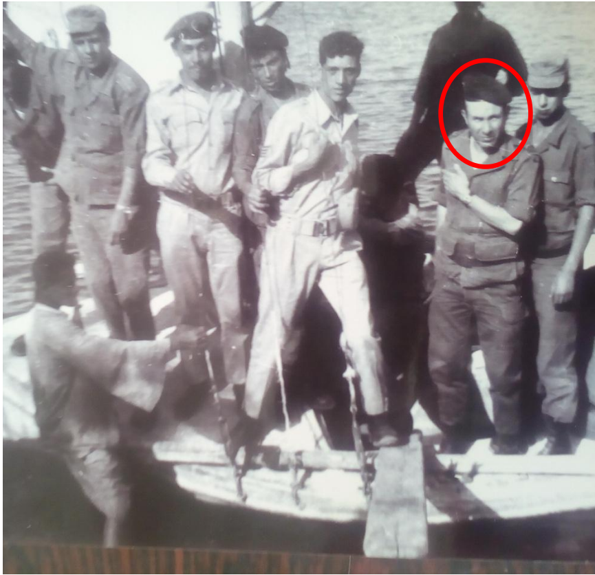
الضابط "السعيد شنقريحة" مع أفراد الجيش الجزائري