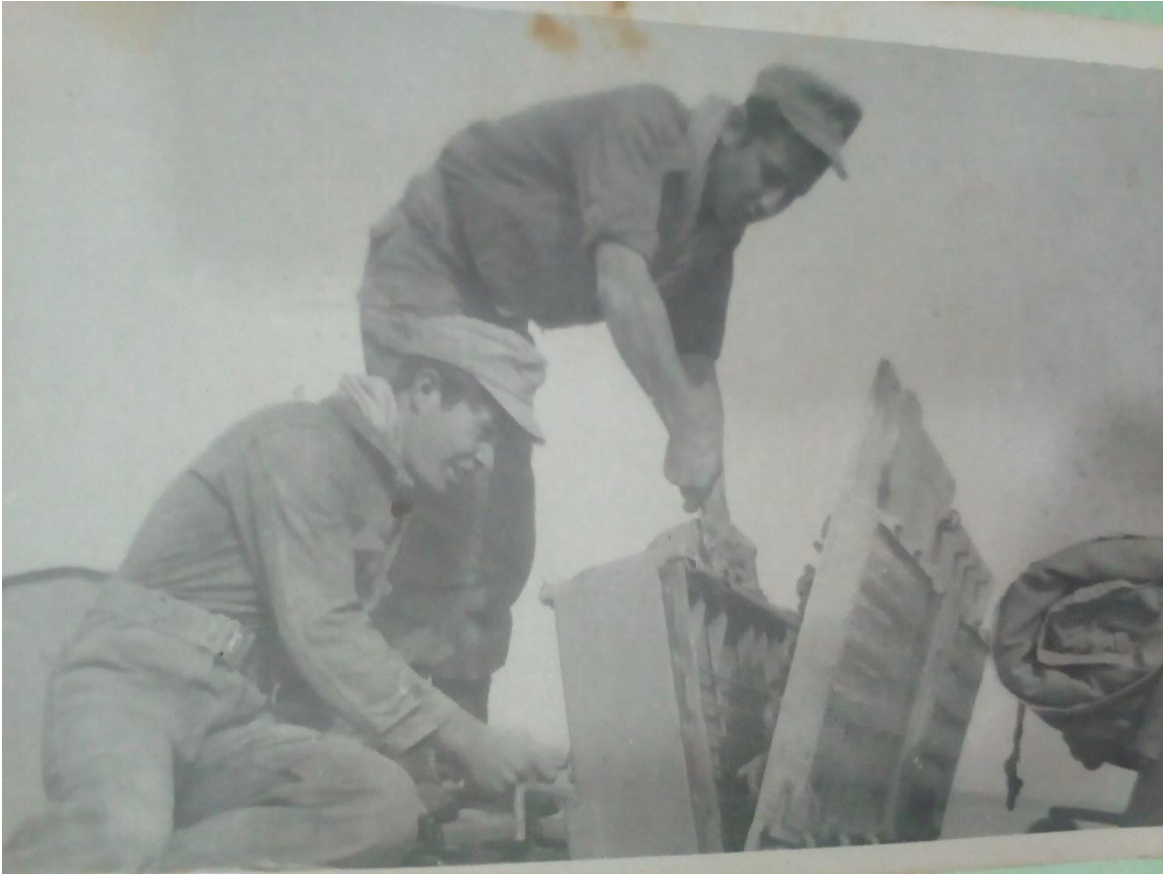
جنود جزائريون يجهزون الذخيرة الحية