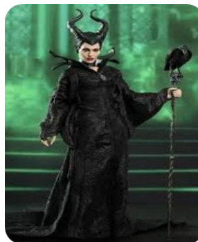
Figure 6 Maléfique 2014