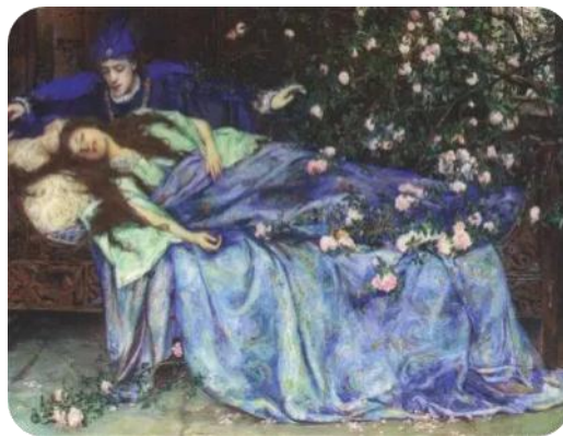
Figure 4 Illustration de Henry Meynell Rheam (1899)

C'est un conte populaire de la tradition orale écrit et réécrit par plusieurs écrivains. La version originale est de loin la plus atroce : digne d'un film d'horreur, il est aussi présent dans le pentamerone de l'italien Basile sous le nom de soleil, lune et Thalia , popularisé par Charles Perrault dans les contes de ma mère l'Oye , parus en 1697 et par les frères Grimm Dormroschen en 1812. 57