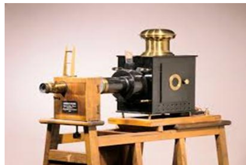
Figure 3 (cinématographe)