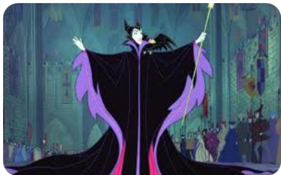
Figure 5 Malefique dans le film la belle au bois dormant (1959)