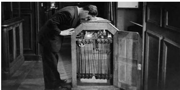
Figure 2 (Le Kinétoscope de Thomas Edison)

Thomas Edison s'inspire de ces inventions et des améliorations techniques de la photographie. Il invente dès 1888 un des premiers appareils de visualisation cinématographique : « le Kinétoscope ». Parallèlement, il développe le système du « kinétographie ». 29 Toutes ces inventions comportent des défauts (les images instables, les appareils sont incapables de gérer convenablement l'enregistrement, l'analyse, la projection et la synthèse des mouvements). Avec l'invention du « cinématographe » par les frères Lumière, qu'ils brevètent le 13 février 1895. 30 Il s'agit de la première caméra industrielle qui permet la projection d'un film sans modification.