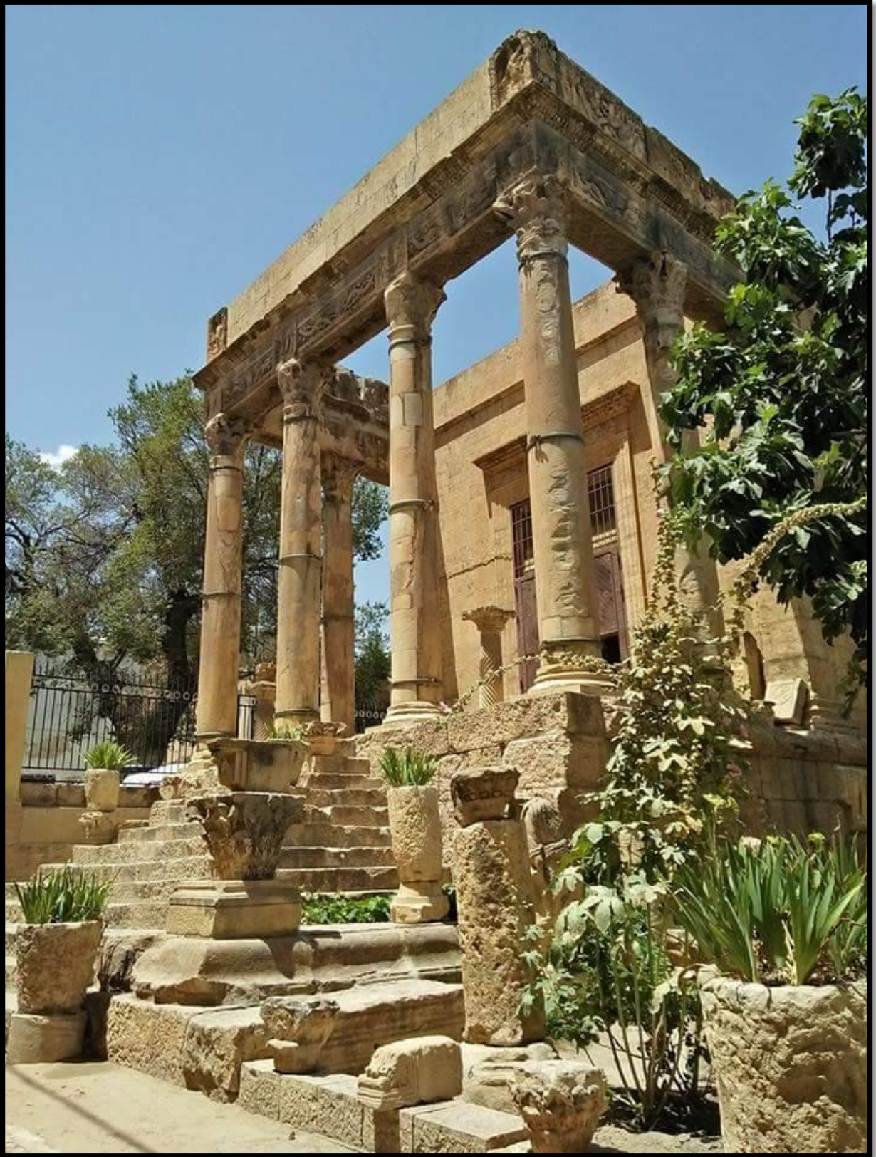
متحف معبد مينارف تبسة