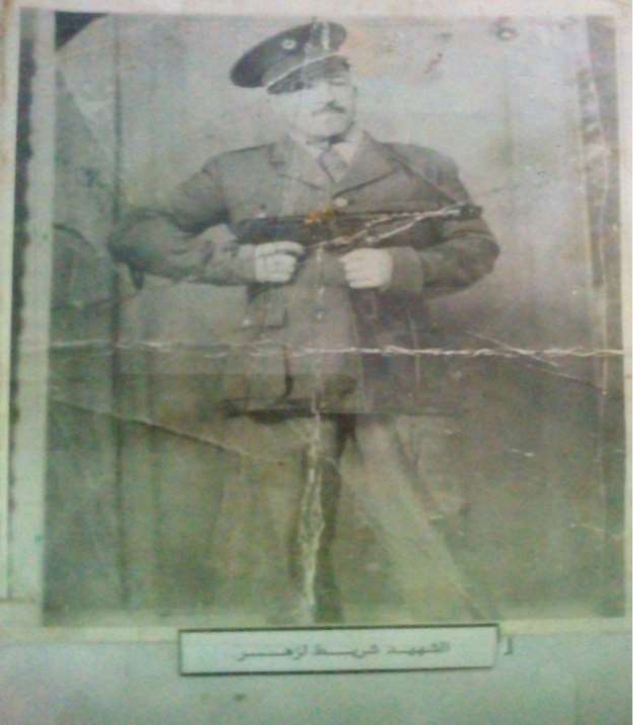
الشهيد شريط زهر