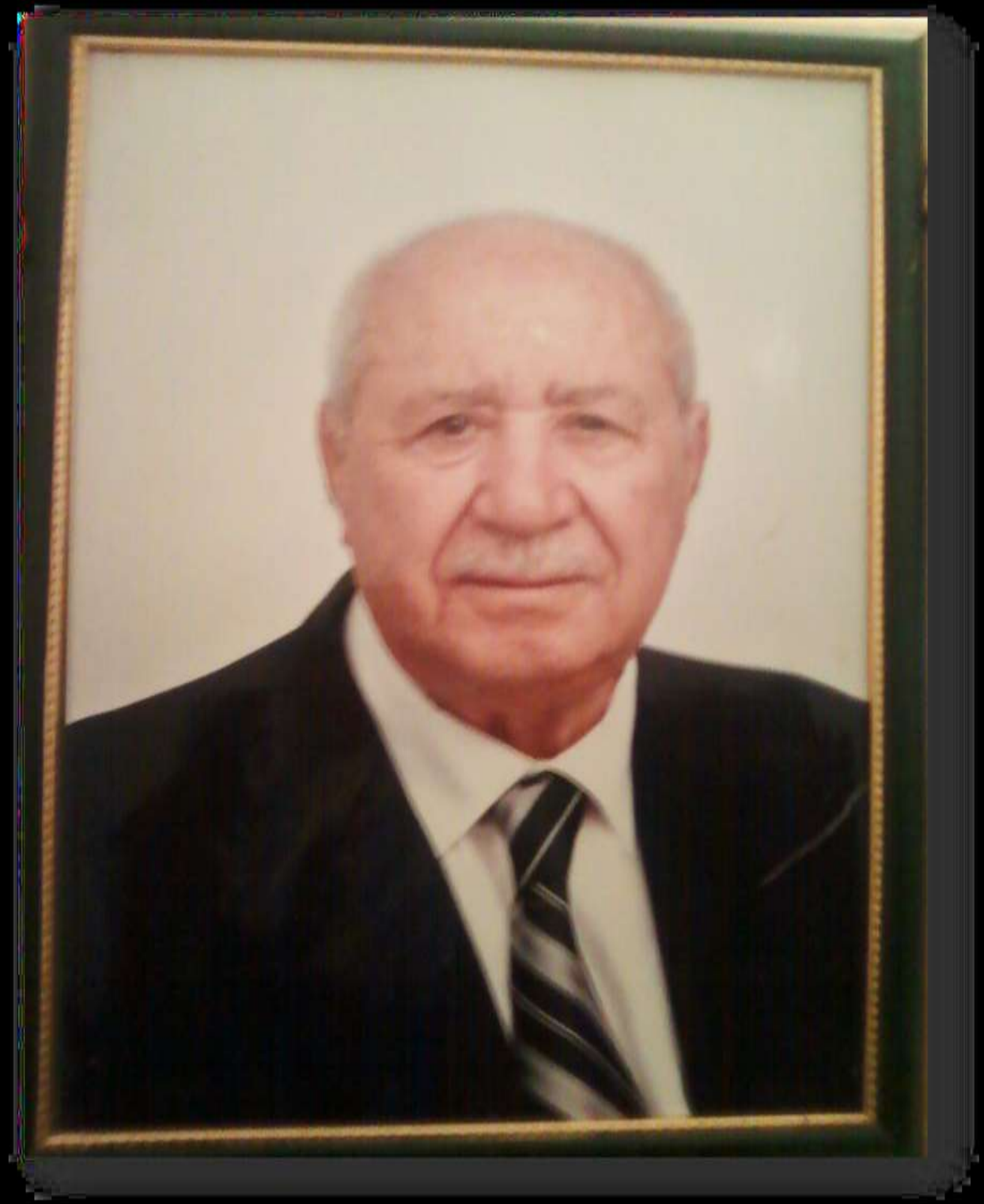
المجاهد الوردي قتال