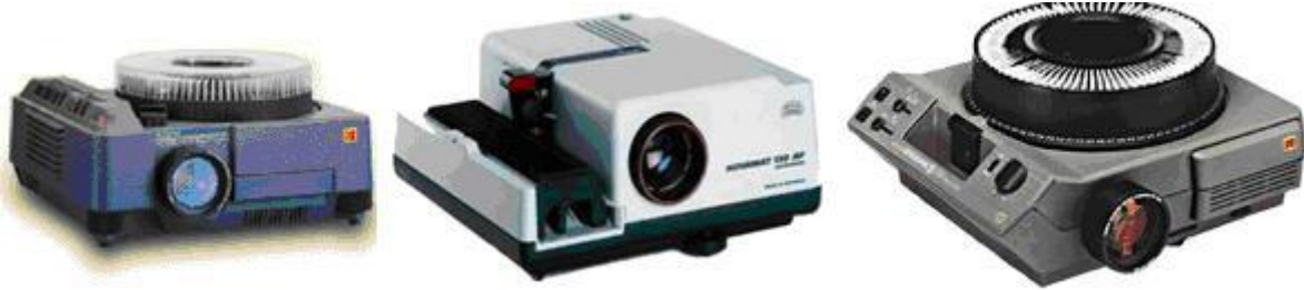
الشكل رقم(01): بعض أنواع جهاز عرض الشرائح.

2- إستخدام الجهاز في عرض نماذج في رياضات مختلفة لمجموعة من اللاعبين الدوليين، فمثلاً يمكن إستخدامه في نموذج لضربة أو ركلة من ركلات الكاراتيه أو الشكل التشريحي للجسم أثناء الطيران أو الوثب.